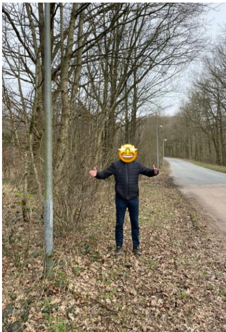
Placering af pylon – Fladhøjvej