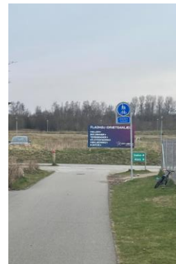
Ønsker: Placering af pylon – indgang skole samt parkering arbejder vi ikke videre med. Grønne skilte fjernes men midlertidige lilla skilte består.