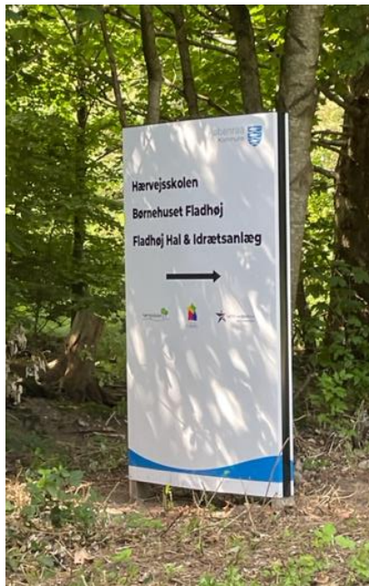
Eableret i juli